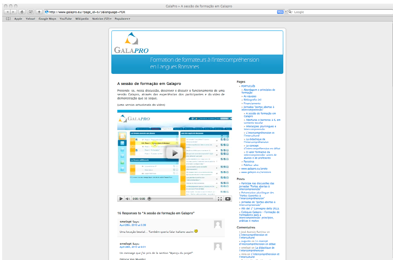
Figura 2. Página de rosto de um dos temas de discussão (a sessão de formação).